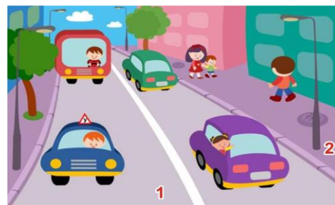
1 - проезжая часть 2 - тротуар

Дорога – это обустроенная или приспособленная и используемая для движения транспортных средств полоса земли либо поверхность искусственного сооружения. Дорога включает в себя одну или несколько проезжих частей , а также трамвайные пути, тротуары , обочины и разделительные полосы при их наличии. Дороги бывают с различным покрытием – асфальтовым, бетонным, булыжным, гравийным (мелкие камушки).